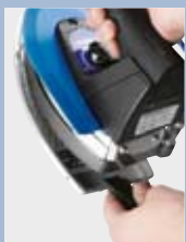
Εύκολη τοποθέτηση πέλματος τeflon