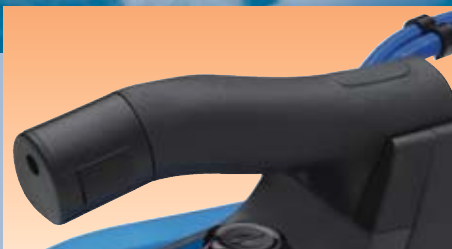
Εργονομική-ανατομική χειρολαβή από Riton . Εργονομικός δικόπτης εντολής ατμού (μπουτόν).