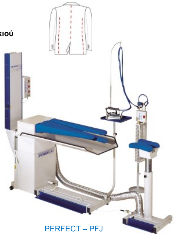
PERFECT – PFJ

Τάση λειτουργίας:.....400V-3ph/N/PE-50Hz ή 230V-1ph-50Hz