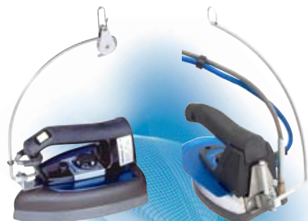
ΣΕΙΡΑ 1700 | Γάντζος