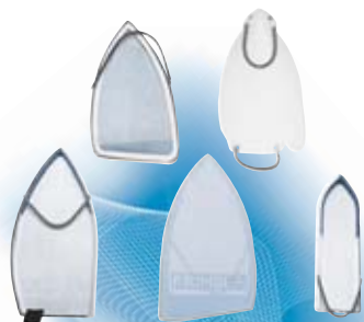
ΠΕΛΑΜΑΤΑ TEFLON & INOX