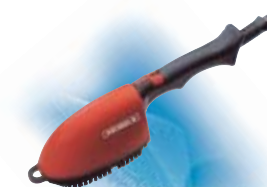
ΒΟΥΡΤΣΙΑ ΑΤΜΟΥ για φινιρίσμα

Υψηλής πίεσης αυτοθερμαινόμενο παραγωγής ξηρού ατμού