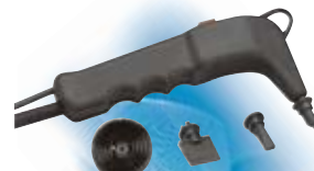
ΠΙΣΤΟΛΙ ΑΤΜΟΥ με εξαρτήματα